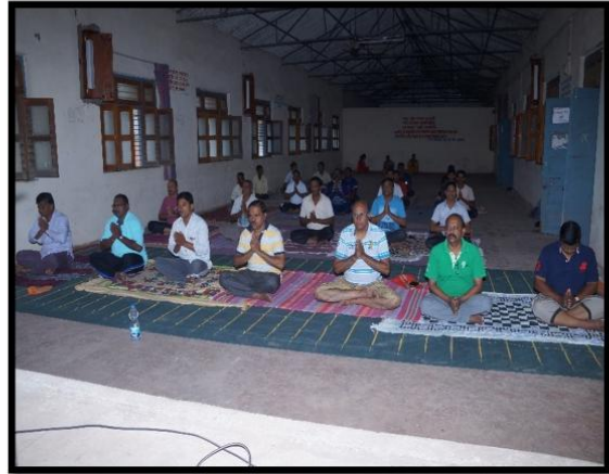
आंतरराष्ट्रीय योगा दिना निमित्त योगा करताना staff व विद्यार्थी