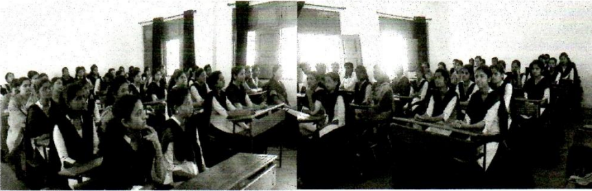
कार्यक्रमासाठी उपस्थित विद्यार्थी वर्ग