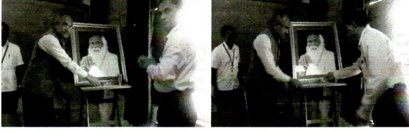
जागतिक लोकसंख्या दिनानिमित्त प्रतिमा पूजन करताना मान्यवर