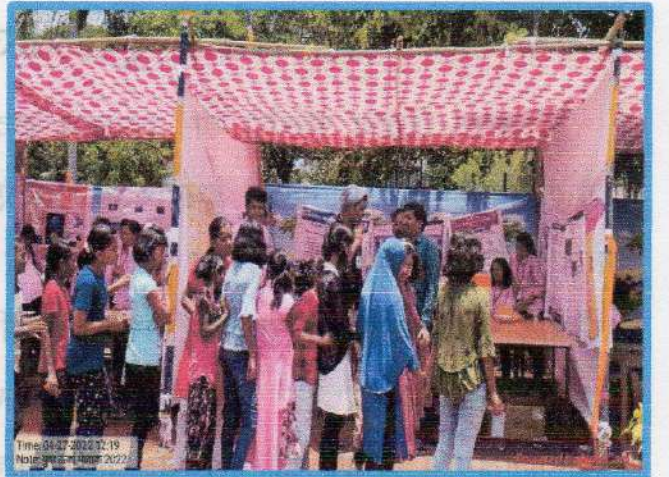
स्टॉलला शाळेचे विद्यार्थी, शिक्षक व ग्रामस्थ यांची भेट