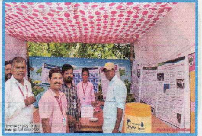
स्टॉलला कार्यक्रमाचे प्रमुख पाहुणे, महाविद्यालयाचे प्राचार्य, शिक्षक व शिक्षकेत्तर स्टाफ यांची भेट